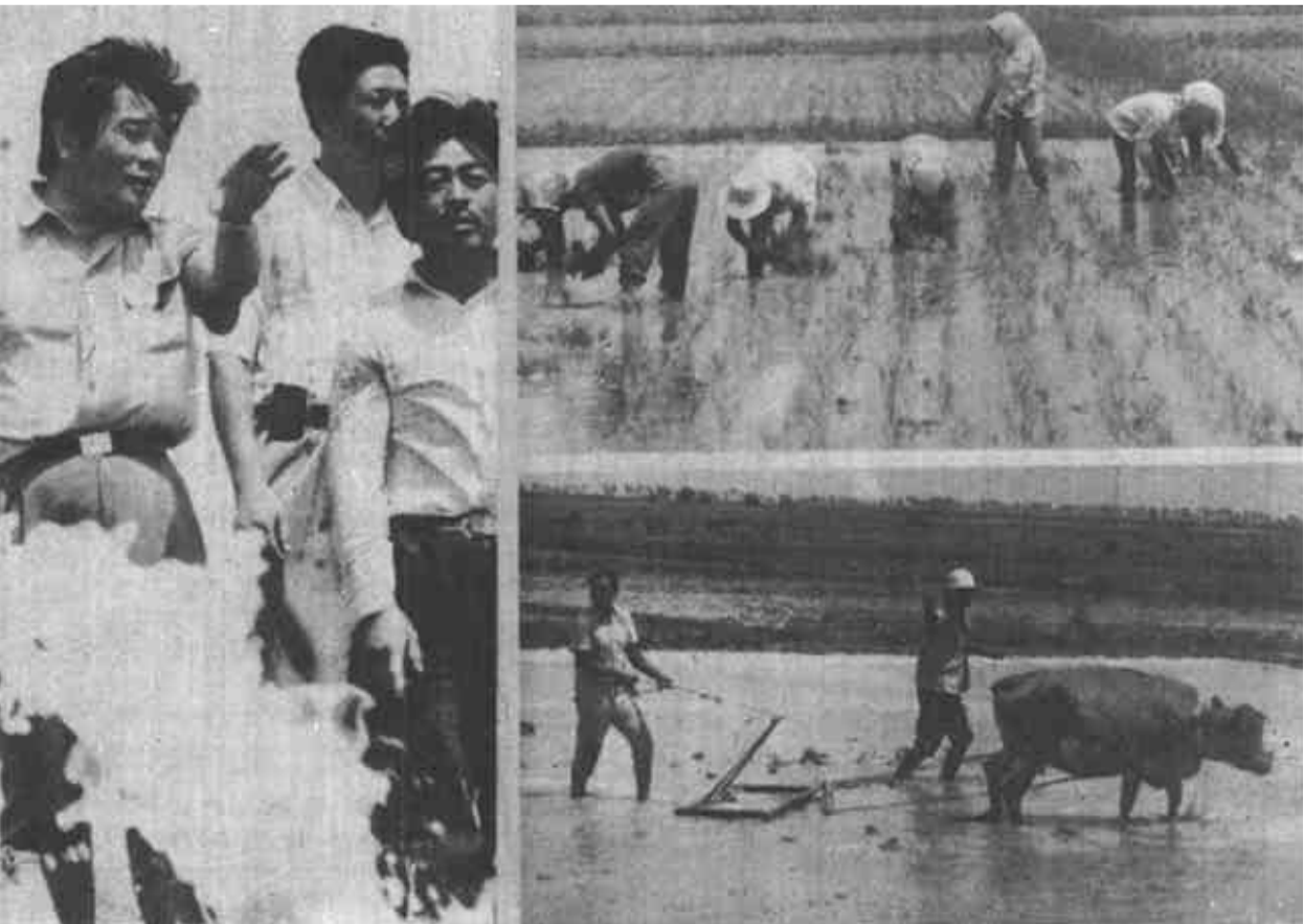
垦利县水稻农场通过及早动手蓄水、场近几年沉寂的局面。今年，该场可保证完严格节水、推广速生水稻品种及鼓励成插秧任务2万亩，比1994年翻两番。种植大户等一系列新举措，一举打破了该

本报讯(记者陈道之) 7月5日，全市大中专学校毕业生就业工作会议召开。副市长郝敦典在会上要求，加强领导，统筹安排，确保毕业生就业安置工作顺利进行。 郝敦典着重从三个方面代表市政府讲了意见。(一)认清形势，统一思想，充分认识做好毕业生就业工作的重要意义。(二)执行政策，坚持原则，切实做好大中专毕业生就业安置工作。(三)加强领导，统筹安排，确保毕业生就业安置工作顺利进行。 郝敦典指出，今年我市预计接收、安置大中专学校毕业生4134人，是历年来毕业生数量最多的一年。从总体上看，这是件大好事。但由于多种因素的影响，给毕业生就业分配带来了难度。为此，他指出，今年的毕业生就业工作要做好以下三个方面的工作。一是认真贯彻落实国家、省、市关于毕业生就业工作的各项政策规定。二是坚持原则，按规定的程序和权限接收、派遣毕业生。三是积极拓宽毕业生就业渠道，广开就业门路。 郝敦典强调，各级各部门要切实加强对毕业生的思想教育；负责毕业生就业安置工作的领导同志要清正廉洁，秉公办事，自觉抵制不正之风的干扰，以确保顺利完成今年的毕业生就业安置任务。